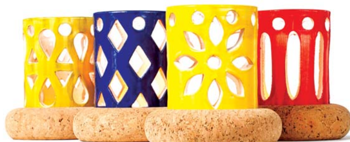
Like Cork

Au cours des dernières années, la coopération entre les acteurs de ces différents milieux, a permis le développement et le lancement d'innombrables articles et collections artisanales singulières.